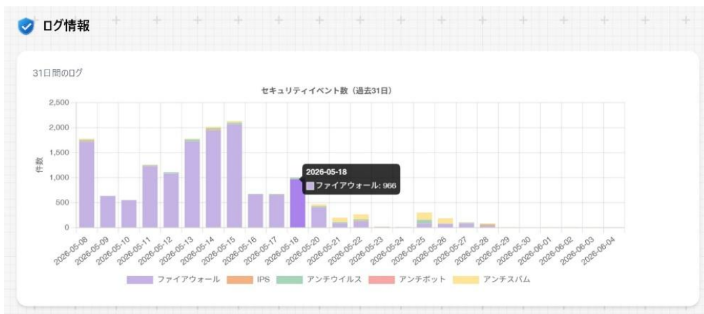
図 3：セキュリティログ傾向（直近 31日）